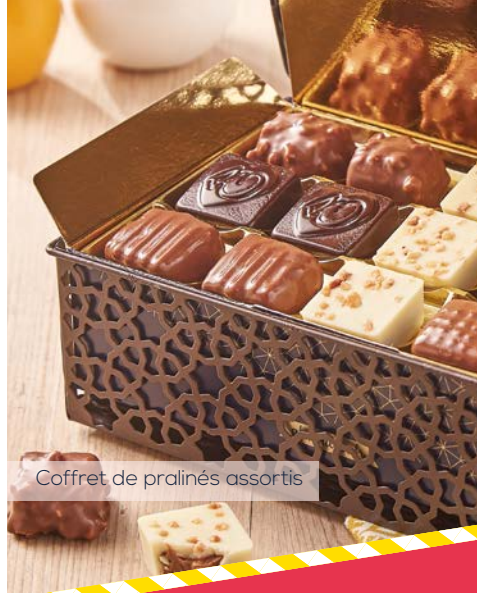
Coffret de pralinés assortis