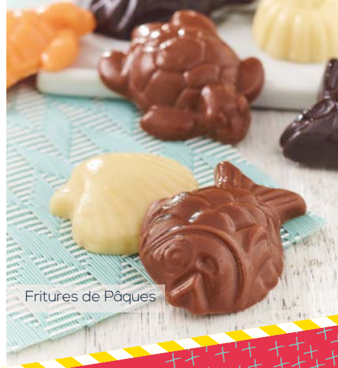
Fritures de Pâques